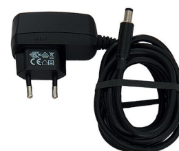
1 alimentation réseau