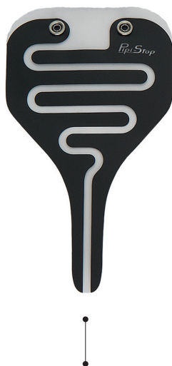
1 détecteur d'urine