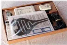
1. Préparer les éléments du Pipi-Stop