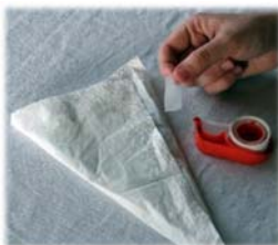
8. Fixer le papier si nécessaire pour éviter un contact direct du détecteur avec la peau