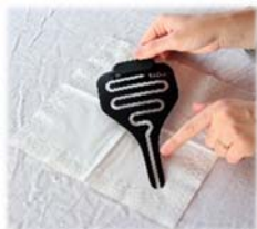
6. Placer le détecteur d'urine sur le papier au centre en diagonale (émetteur dessus / Pipi-Stop est lisible)