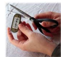
3. Déballer l'émetteur