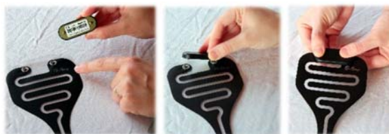
4. Fixer l'émetteur sur le détecteur d'urine. Le sens de la polarité ne joue aucun rôle