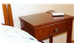
10. Placer le récepteur sur la table de nuit (hors de portée de l'enfant)