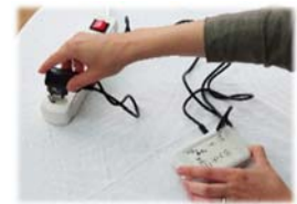
12. Brancher l'alimentation à une prise 230 Volts → la lampe témoin bleue s'allume + signal sonore