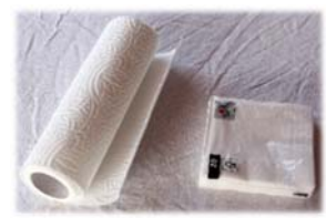
5. Préparer le papier ou la serviette