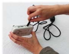
11. Introduire la fiche ronde de l'alimen- tation dans la prise à l'arrière du récepteur