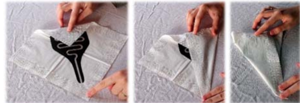
7. Replier le papier sur le détecteur