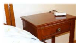
10. Empfänger auf den Nachttisch stellen (ausser Reichweite des Kindes)