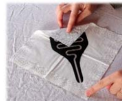
7. Papier über die Urin-Folie falten