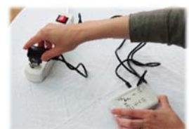
12. Netzadapter an einer Steckdose 230V anschiessen → blaue Kontroll-Lampe leuchtet auf + akustisches Signal