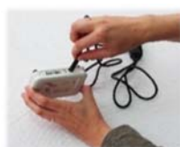
11. Den runden Stecker des Netzadapters in die Kupplung hinten am Empfänger einstecken