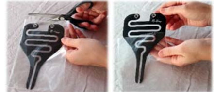
2. Urin-Folie auspacken