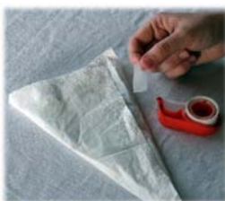
8. Wenn nötig Papier fixieren, um einen direkten Kontakt der Urin-Folie mit der Haut zu vermeiden