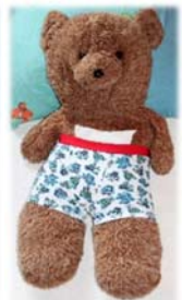
9. Urin-Folie im Slip platzieren, auf dem Bauch des Kindes, mit der Zunge zwischen den Beinen. Die Urin-Folie darf nicht gefalzt werden, aber es ist normal, dass sie die Körperform annimmt.

Idealerweise platzieren Sie die Urin-Folie und den Sender zwischen 2 Unterhosen. Somit werden eventuelle Fehlalarme durch Schweiß vermieden und die Elemente werden besser fixiert.