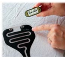
4. Sender auf der Urin-Folie fixieren. Die Polarität spielt keine Rolle.