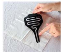
6. Urin-Folie diagonal in der Mitte auf dem Papier platzieren (Sender oben / Pipi-Stop muss lesbar sein)