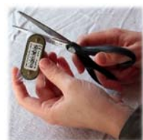
3. Sender auspacken